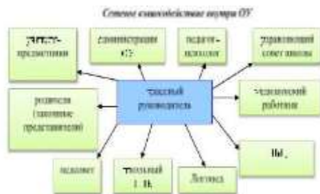
Сетевое взаимодействие с различными организациями